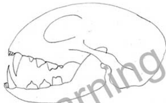
Abb. 2: Gebiss der Katze