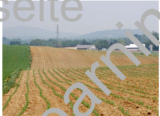
Abb. 1: Maisfeld Anfang Juni

Mais gehört zu den wichtigsten Nutzpflanzen weltweit. Er findet als Nahrung, Tierfutter, Industrie- und Energiepflanze Verwendung. Auch in Mitteleuropa wird er seit den 1970er Jahren zunehmend häufiger angebaut. Mais stammt ursprünglich aus Mittelamerika. Er braucht ein ökologisches Temperaturminimum von 8 bis 10 °C um keimen zu können. Diese Temperatur wird in den meisten Gebieten Mitteleuropas erst Mitte Mai erreicht, d. h. etwa sechs bis acht Wochen nach Beginn der Vegetationsperiode der einheimischen Pflanzenarten. Der Reihenabstand zwischen den Pflanzen sollte 65 Zentimeter betragen, um ein optimales Wachstum zu gewährleisten. Der Anbau von Mais gestaltete sich in Mitteleuropa zunächst ausgesprochen schwierig. Regelmäßig wurden die Maiskeimlinge von einheimischen Wildkräutern überwuchert und gingen ein.