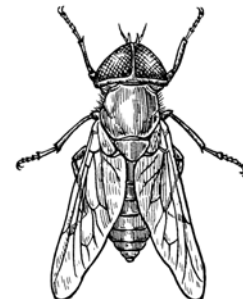
Abb. 3: Bremse